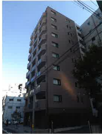
天満泉マンション