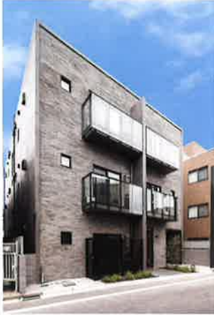
サウンドプルーフプロ蒲田

不動産仲介、自社所有建物賃貸、巴コーポレーション所有のビル管理をはじめ、「勝どき東地区第一種市街地再開発事業」の組合員として参加しています。