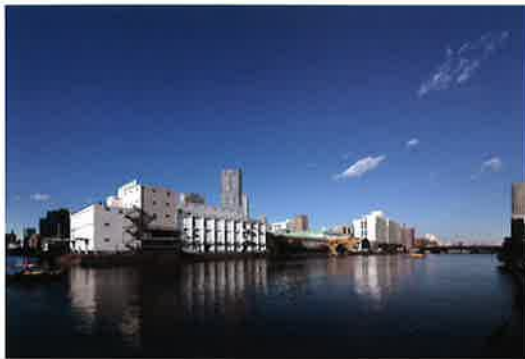
勝どき東地区第一種市街地再開発事業 (第1期工事:2023年8月末竣工予定)