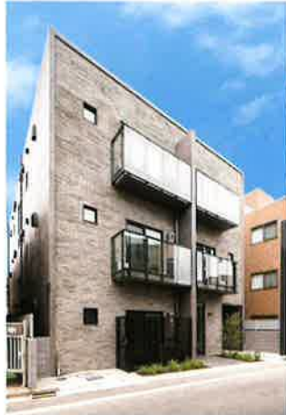
サウンドプルーフプロ蒲田

不動産仲介、自社所有建物賃貸、巴コーポレーション所有のビル管理をはじめ、「勝どき東地区第一種市街地再開発事業」の組合員として参加しています。