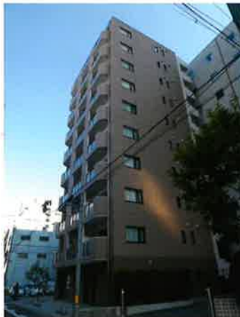
天満泉マンション