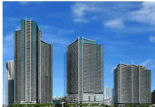
勝どき東地区第一種市街地再開発事業 (第1期工事:2023年8月末竣工予定)